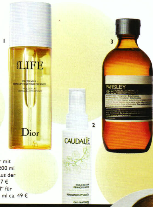
1 „Hydra Life Oil to Milk“-Cleanser mit Haberleblättereextrakt von Dior , 200 ml ca. 35 € 2 „Reinigendes Pflegeöl“ aus der Mandel von Caudalie , 100 ml ca. 17 € 3 „Parsley Seed Facial Cleansing Oil“ für empfindliche Haut von Aesop , 200 ml ca. 49 €