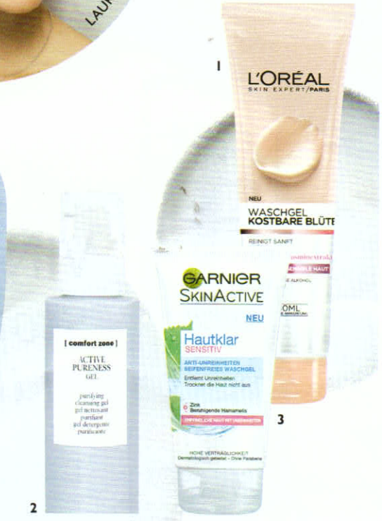
1 „Kostbare Blüten Waschgel“ mit Rosenextrakt von L'Oréal Paris , 150 ml ca. 5 € 2 Mit exfolierendem Effekt: „Active Pureness Hautklärendes Reinigungsgel“ von Comfort Zone , 200 ml ca. 29 €, etwa über comfortzone.de 3 „Hautklar Sensitiv Anti-Unreinheiten Seifenfreies Waschgel“ mit Zink von Garnier , 150 ml ca. 4 €