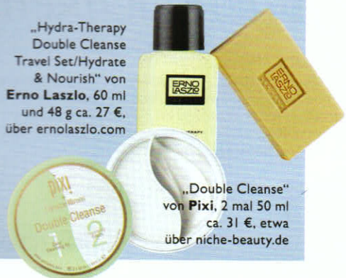
„Hydra-Therapy Double Cleanse Travel Set/Hydrate & Nourish“ von Erno Laszlo , 60 ml und 48 g ca. 27 €, über ernolaszlo.com

Besonders praktisch: Cleanser-Sets, die einen Reiner auf Öl- und einen auf Wasserbasis enthalten.